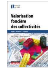
Valorisation foncière des collectivités Editions le Moniteur, 2020