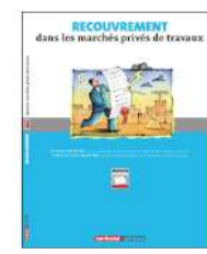
Recouvrement dans les marchés privés de travaux Territorial Éditions 2009