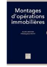
Montages d'opérations immobilières Éditions EFE 2 e édition 2018