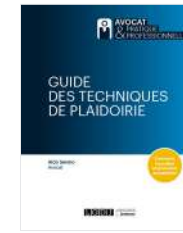
Guide des techniques de plaidoirie Editions LGDJ, 2022

Aldo SEVINO est l'auteur de plusieurs ouvrages de référence (voir ci-contre).