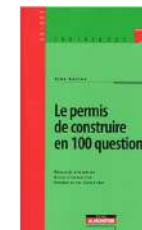
Le permis de construire en 100 questions Le Moniteur, Guides juridiques, 2009