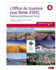
L'office de tourisme sous forme d'EPIC Berger Levrault, 2013