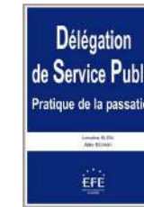
Délégation de service public Pratique de la passation Edition EFE Mars 2013