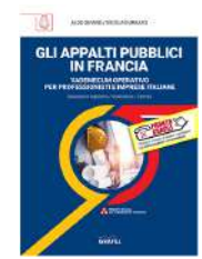
Gli appalti pubblici in Francia GRAFILL, 2020