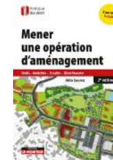
Mener une opération d'aménagement Moniteur 2 e édition 2019